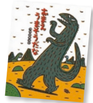
『おまえうまそうだな』(ポプラ社) 作・絵 宮西達也

父と子の愛、母と子の愛、友情などさまざまな愛の形を描く感動の物語絵本シリーズ。らんぼうものに見えるティラノサウルスにめばえる優しい気持ちは、子どもから大人まで幅広い世代に感動を呼んでいます。「本当の強さってなんだろう?」「優しくってどんなもの?」。いつもだれかを想っているきょうりゅうたちの絆の物語です。